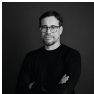
Design by Fabian Zimmerli

Hvala svim ljudima koji su uključeni u ovaj projekat: Barri Huang sa Alanom Luom za njihov angažman i organizaciju, Džeri Li i Šen Jongđiu za glavni inženjerski CAD rad, Mario Rotenbuhler za fotografije, Fabian Zimmerli za treperavu ideju i dizajn, Matti Valker za grafički rad.